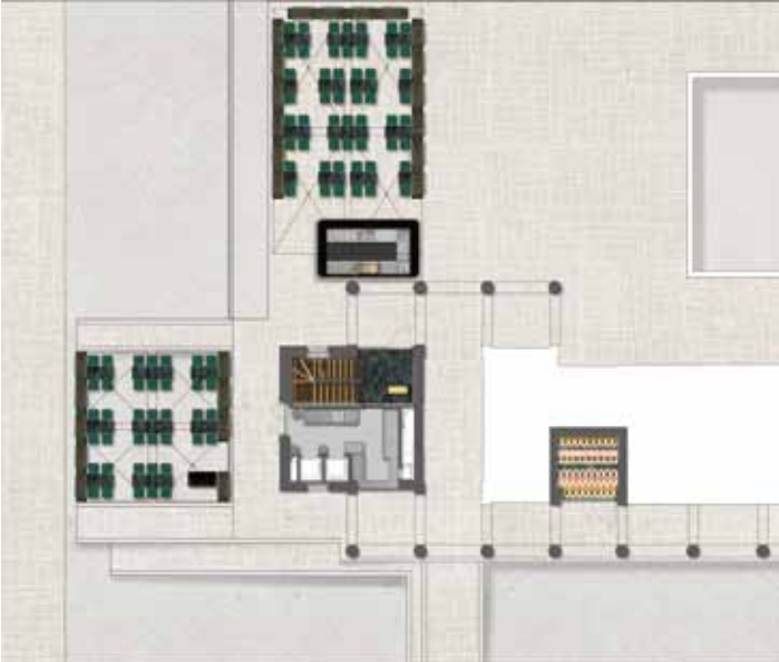
1ST FLOOR PLAN